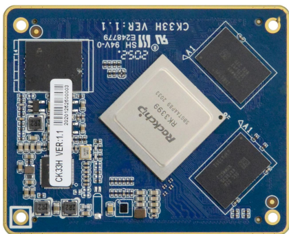
CK33H VER:1.1 主板正面图